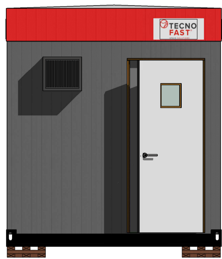
C Esc.: 1:25