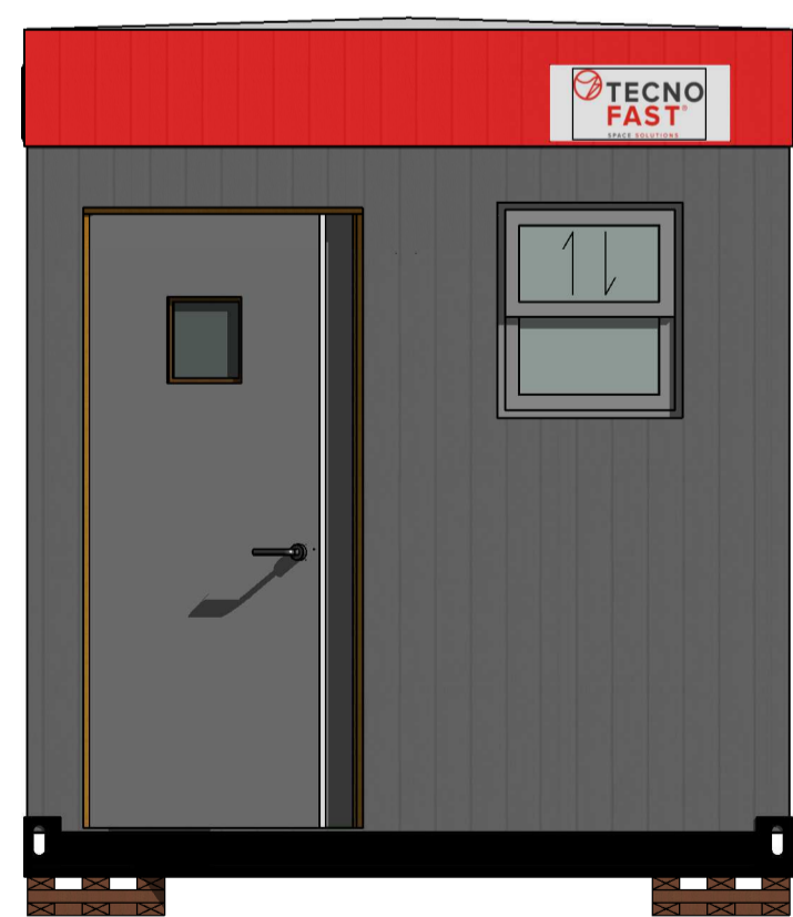
C Esc.: 1:25