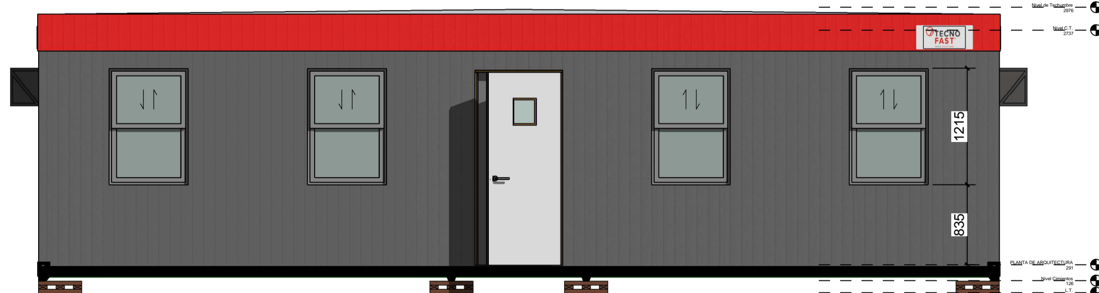
D Esc.: 1:35