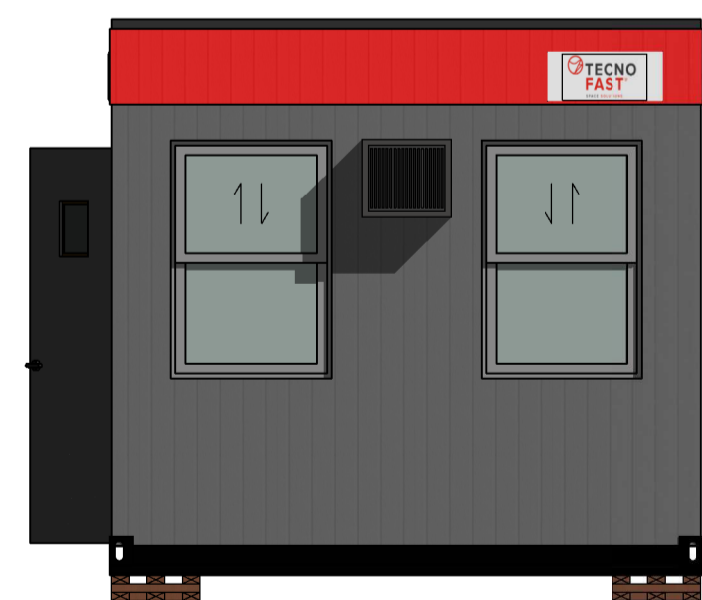
C Esc.: 1:35