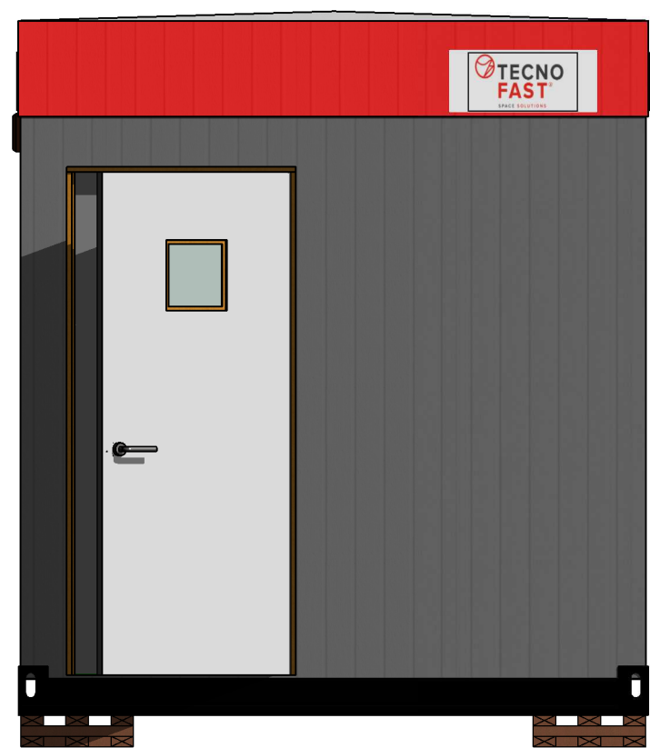
C Esc.: 1:25