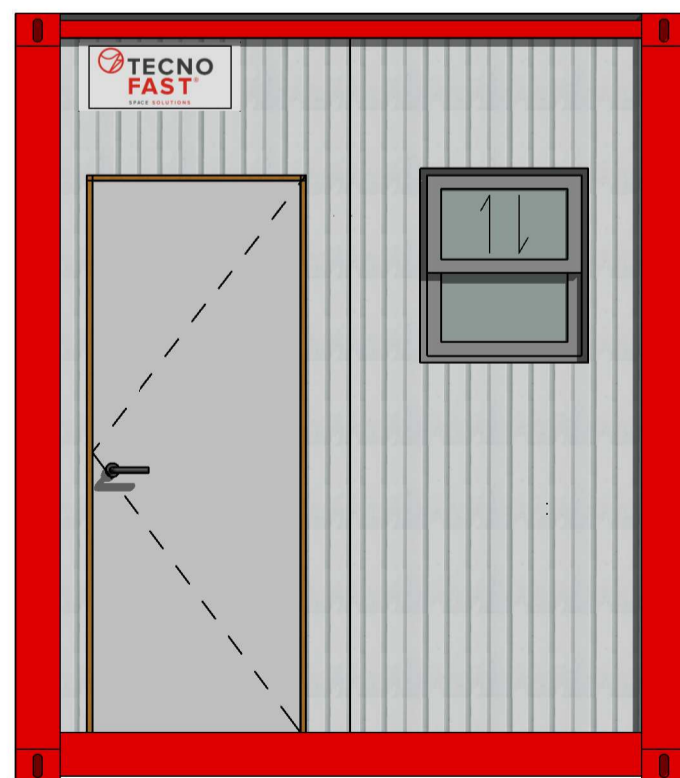
C Escala: 1:25