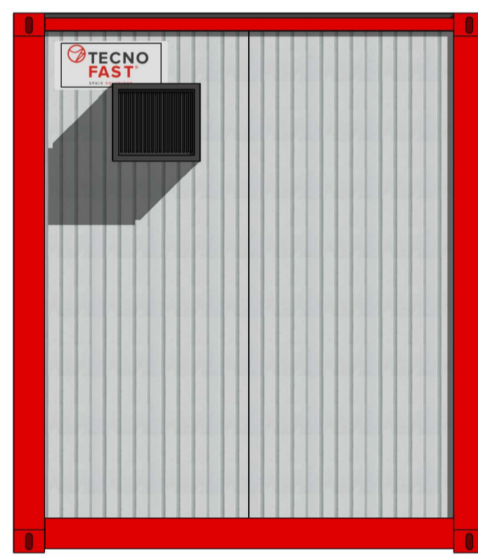
A Escala: 1:25