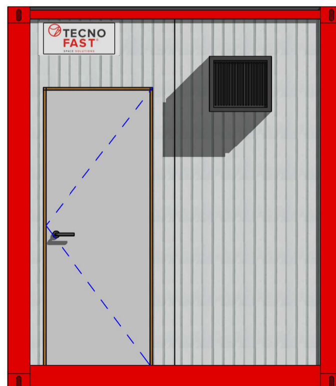
C Escala: 1:25