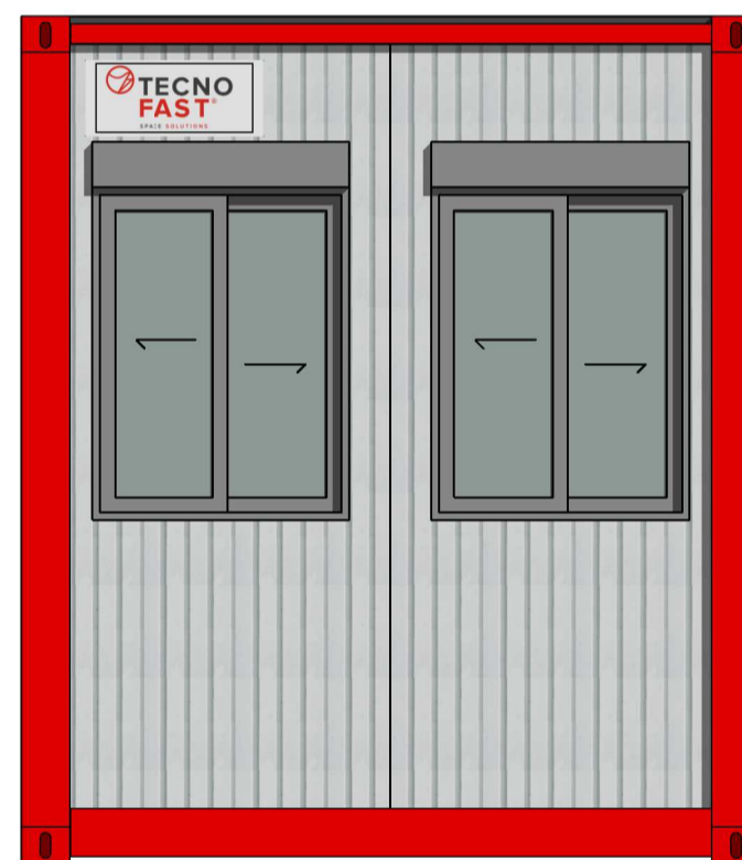
A Escala: 1:25