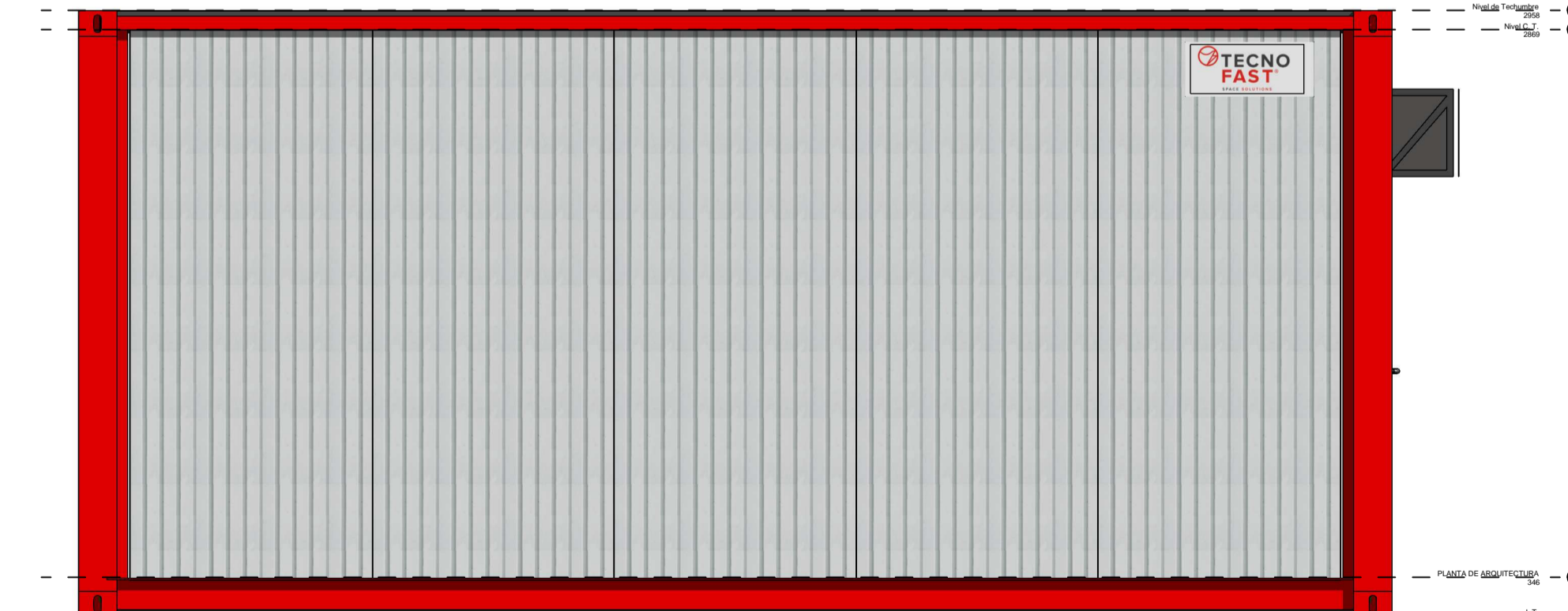
D Escala: 1:25